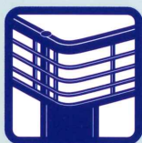
フラットフェイス