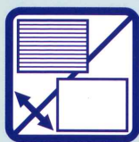
リバーシブルパネル

リバーシブルの腰パネルにより、用途に応じて高級なイメージの木目か、シンプルなイメージのホワイトのどちらかを選ぶことができます。