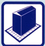
ストックスペース