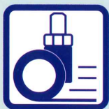
スムーズキャスター

耐摩耗性に優れた50φ径のナイロン樹脂キャスターにより、スムーズな移動が可能です。